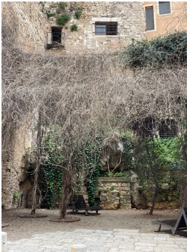
Ubicación: Plazuela de San Feliù, Girona