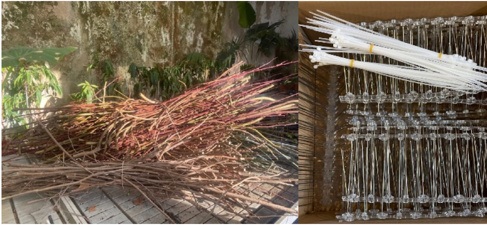
Materiales: ramas, bridas, plásticos y espinas anti-pájaros