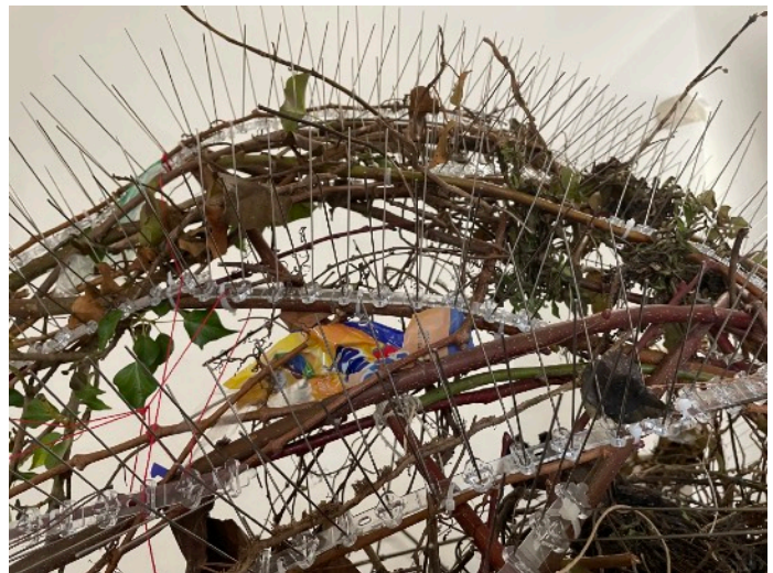
detalles del nido grande de Laura Lio con espinas anti-pájaros, ramas y plásticos