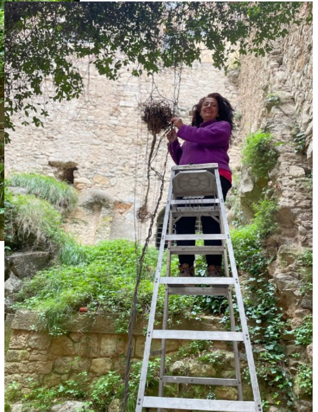
Nido pequeño y su colocación en la Plazuela de San Feliù