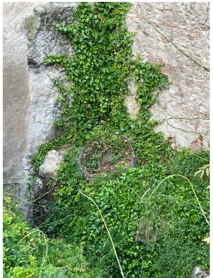
Nido grande colocado en la Plazuela de San Feliù