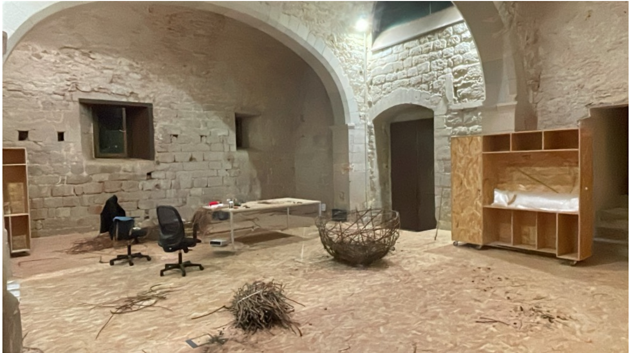
Centro de Creación Contemporánea de Girona, Capella de Santa Llucia