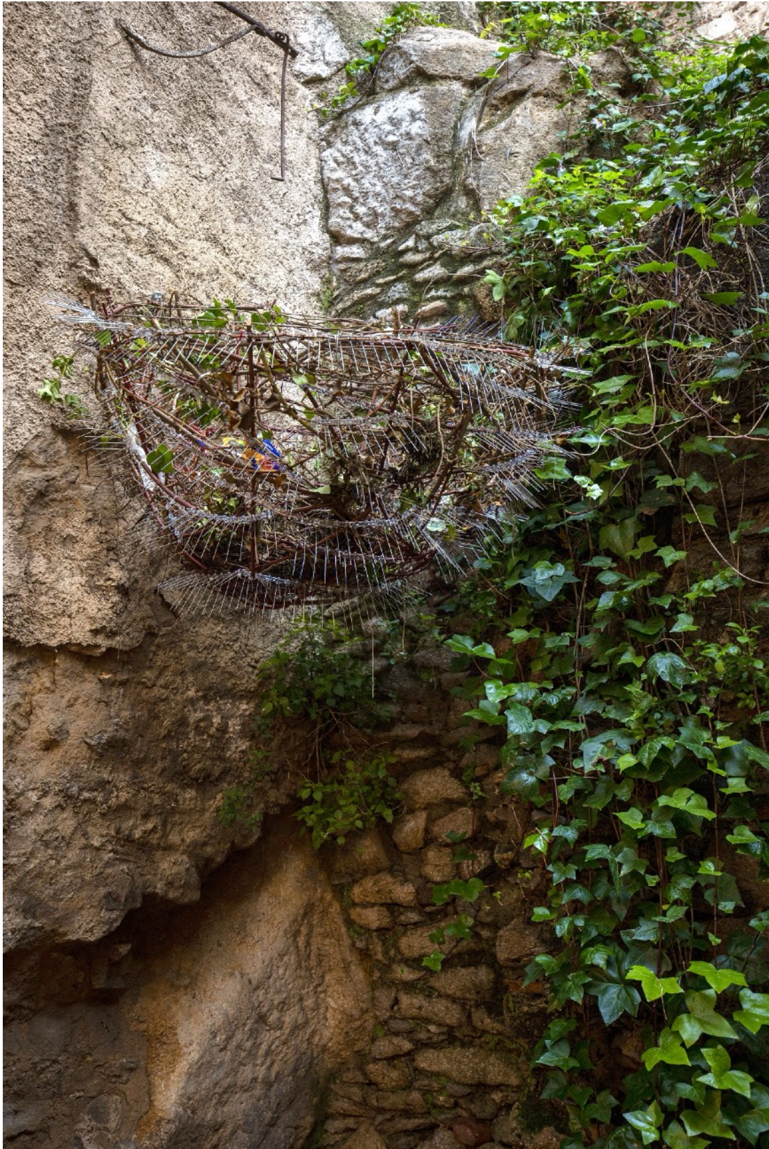
De-vuelta al remitente I, ramas y espinas anti-pájaros, 2025