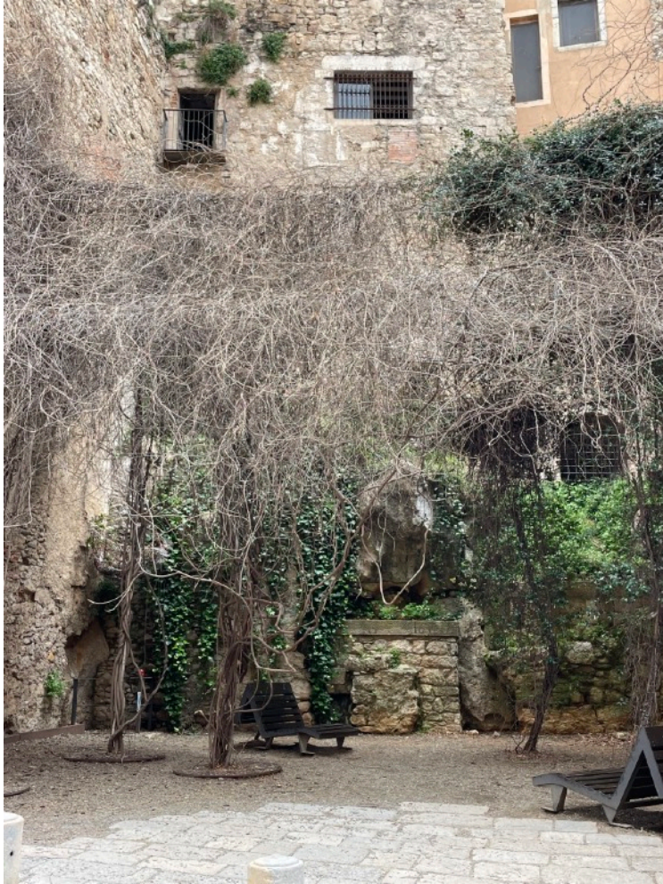
Plaza de San Feliú, Gerona, 2025