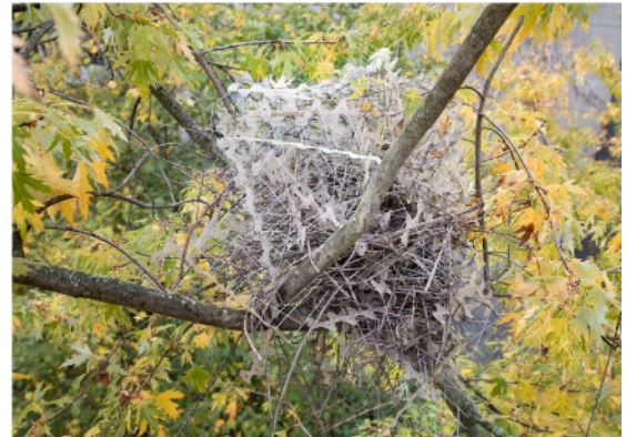
A magpie nest in Antwerp, Belgium. (Juke-Florijn Hiemstra)