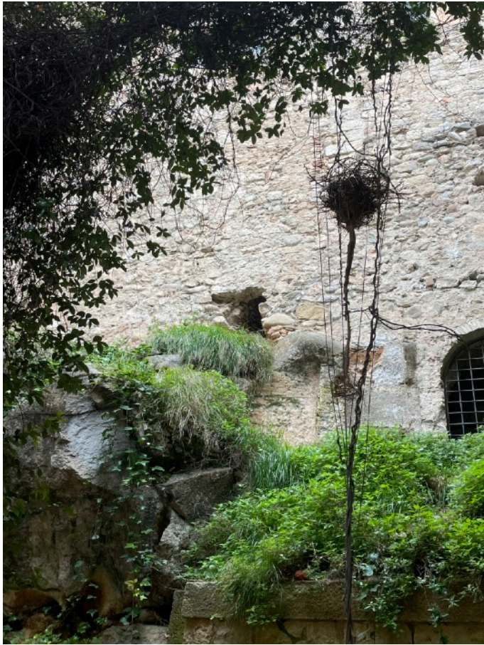
De-vuelta al remitente II