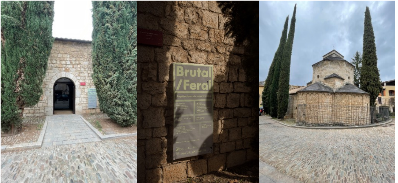
Bòlit, Capilla de San Nicolás, Gerona