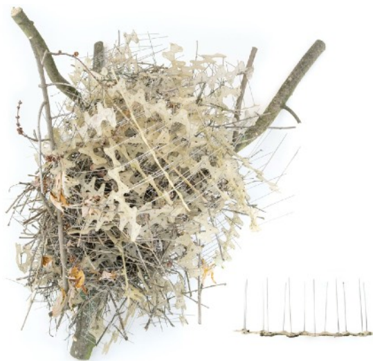
Nidos con espinas anti-pájaros hechos por las urracas