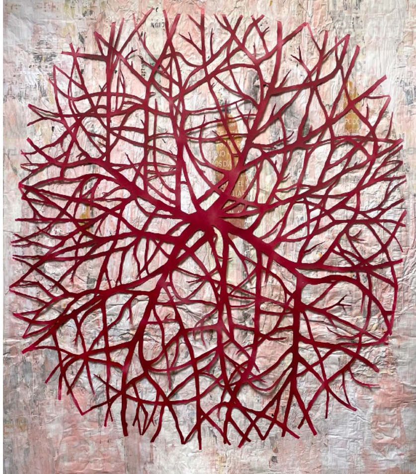
Savia sangre. El viaje de la semilla , Laura Lio, 180 x 160 cm., año 2023

Savia sangre, el viaje de la semilla surgió buscando carteles callejeros. Fue entonces cuando encontré una semilla que había germinado entre ese sustrato de papeles encolados entre sí y a los muros de la ciudad. Ese fue el inicio que generó estas piezas a modo de reflexión emocional sobre la vida, su posibilidad y perseverancia en lugares muy alterados por nosotr@s, como son los ecosistemas urbanos.